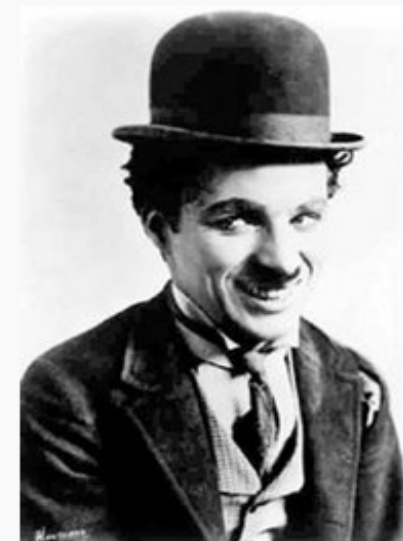
Chaplin in his costume as The Tramp .

Born: April 16, 1889 Walworth, London, England